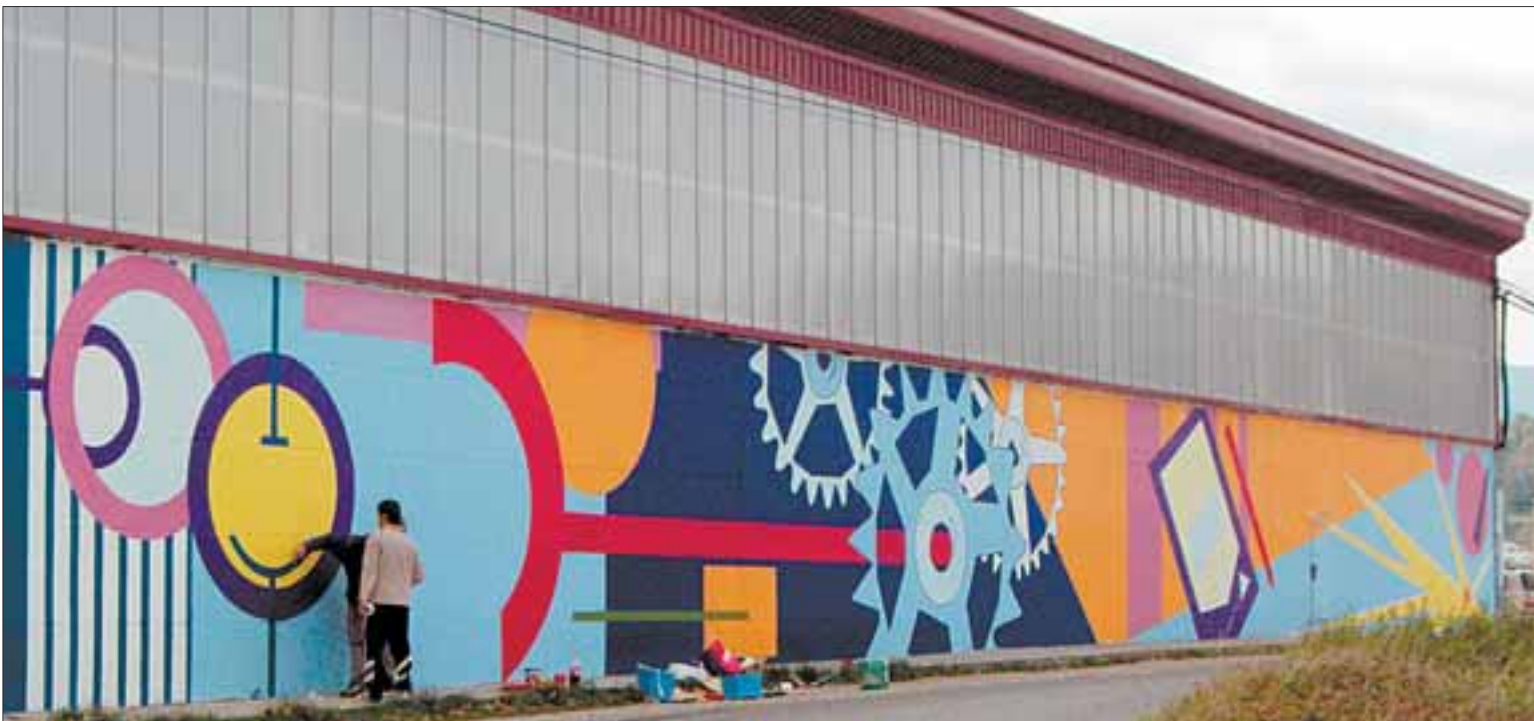
En la imagen, el mural, sin título, que decora uno de los laterales del instituto de Formación Profesional San Miguel de Aralar de Alsasua.